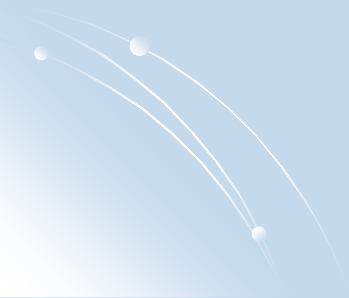
Схема побудови розділу 1